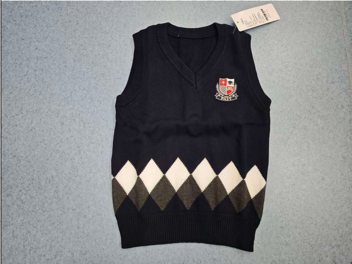
藏青/灰/白色针织背心